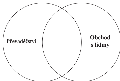
Graf 1: Vztah mezi převaděčstvím a obchodem s lidmi

V praxi jsou převaděčství a obchod často propojeny, jak naznačuje schéma č. 1: